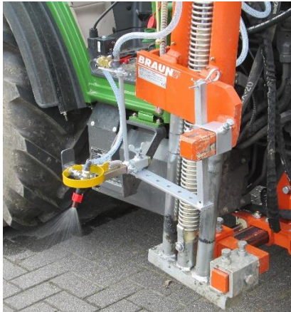
Bild 1 Anbau Fa. Braun Fendt Vario rechts