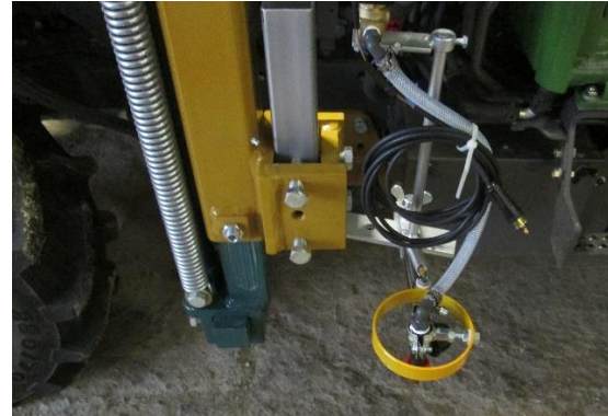
Bild 4 Anbau Fa. Rust Fendt Vario links