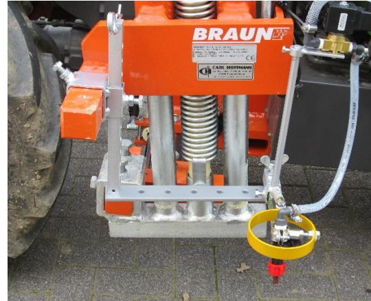
Bild 2 Anbau Fa. Braun Fendt Vario links