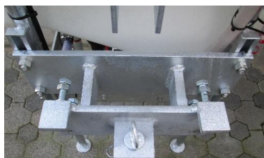
Anbaukonsole auf Dreipunktseite