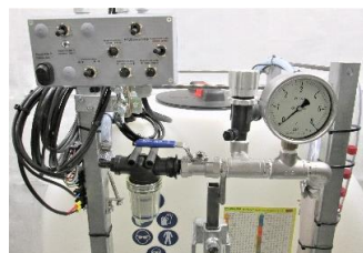
Druckregleinheit mit Steuerung