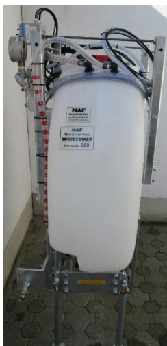
Ansicht von rechts