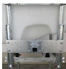
Montagebrücke für MAF uni Bandspritzgestänge