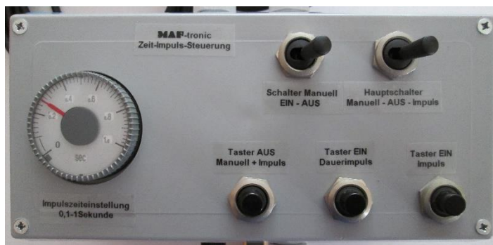
Steuerbox mit Zeiteinstellung und Funktionsschalter für linke oder rechte Seite