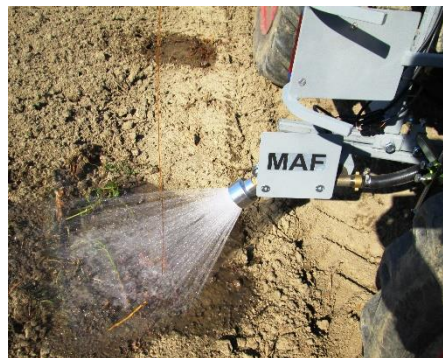
Gießstrahl nach Sensorauslösung durch Rankdraht ( Parameter: Spritzdruck und Zeitimpuls)