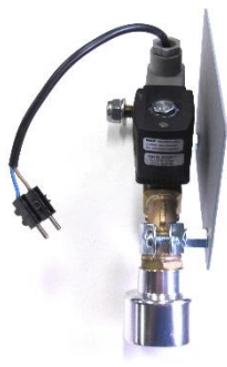
Magnetventilblock mit Gießbrause (Auslieferungszustand)