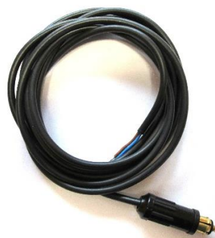
Pos. 4 Anschlußkabel Fendt Vario Joystick (es werden 2 Stck benötigt)