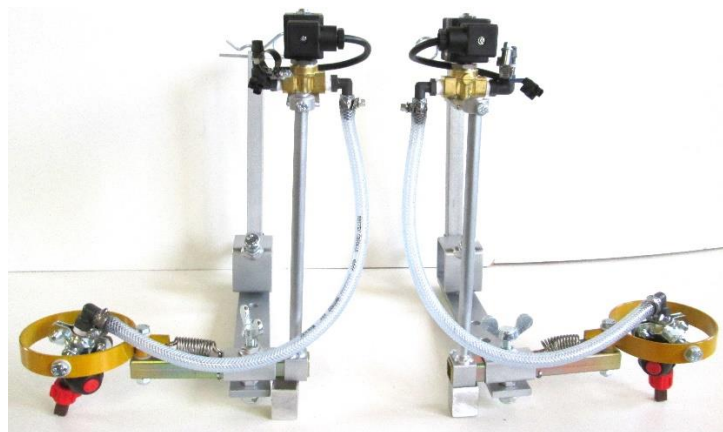
Pos. 1 Anbausatz Fa. Braun