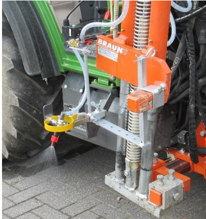
Bild 1 Anbau Fa. Braun Fendt Vario rechts