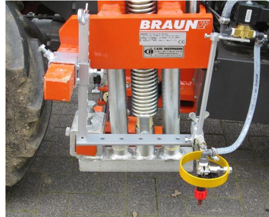
Bild 2 Anbau Fa. Braun Fendt Vario links