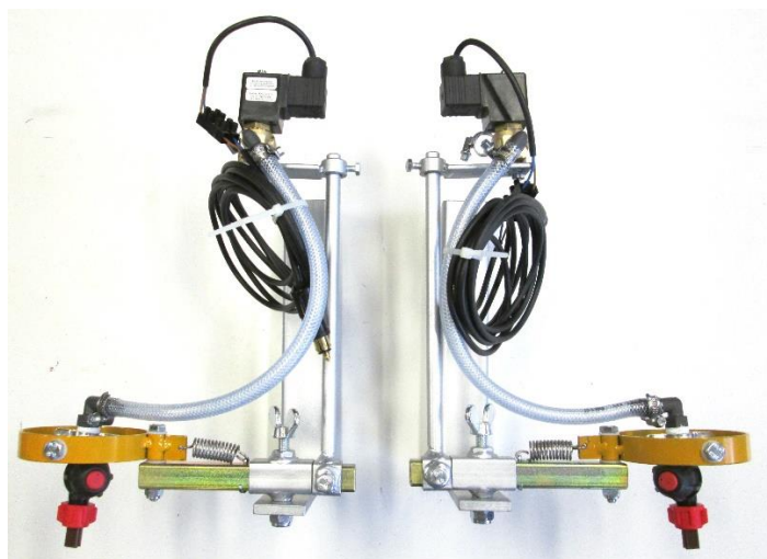
Pos. 2 Anbausatz Fa. Rust