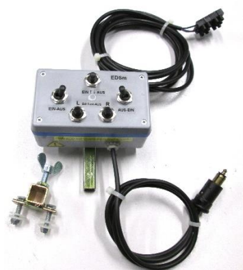
Pos. 3 Elektrische Ansteuerung