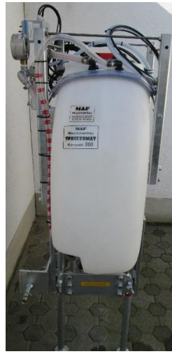
Ansicht von rechts