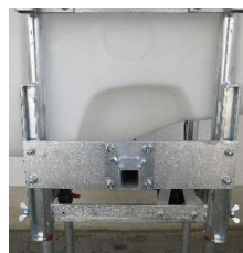
Montagebrücke für MAF uni Bandspritzgestänge