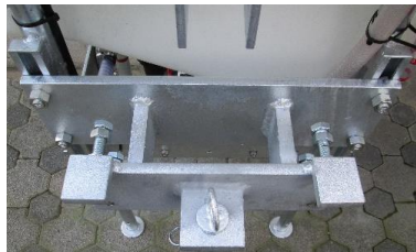
Anbaukonsole auf Dreipunktseite