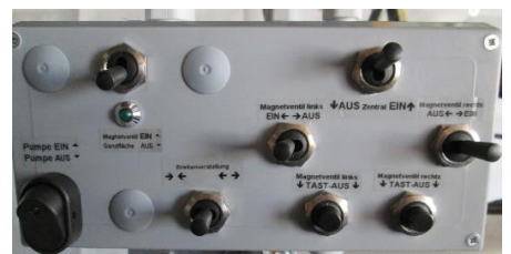
Elektrische Ansteuerung Typ 4 für Spritze mit Gestänge