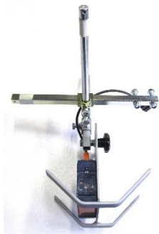
Sensormodul 2-teilig mit Halter (Auslieferungszustand)