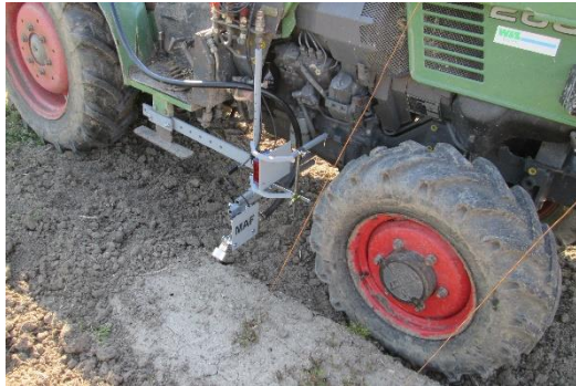
Zwischenachs-Anbau rechts an Fendt 260V (Anbauteile teilweise Sonderanfertigung)