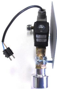
Magnetventilblock mit Gießbrause (Auslieferungszustand)