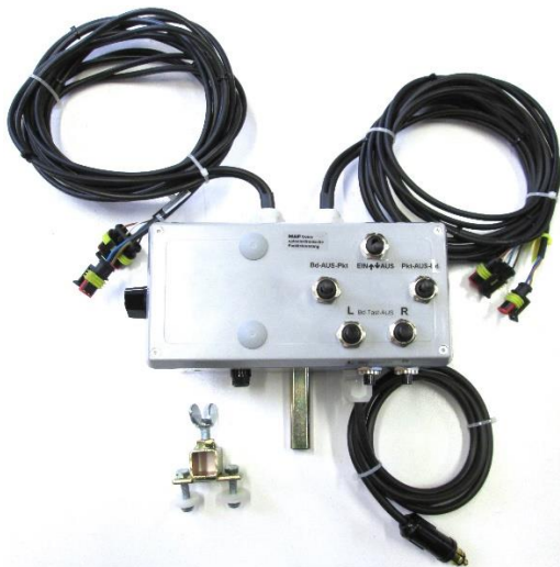
Steuerbox mit Zeiteinstellung und Funktionsschalter für linke und rechte Seite