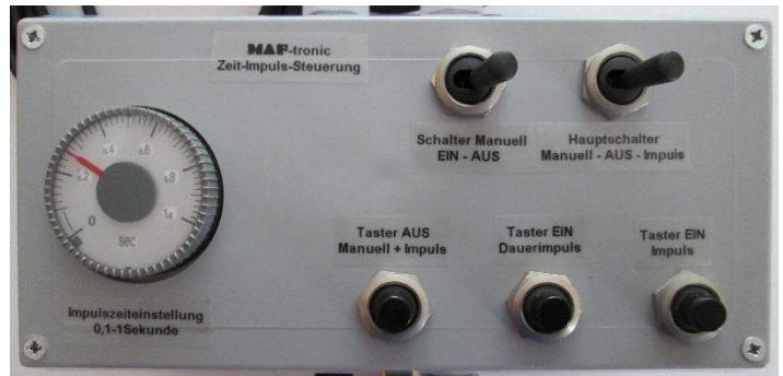
Steuerbox mit Zeiteinstellung und Funktionsschalter für linke oder rechte Seite