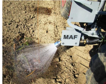
Gießstrahl nach Sensorauslösung durch Rankdraht (Parameter: Spritzdruck und Zeitimpuls)