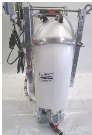
Ansicht von links