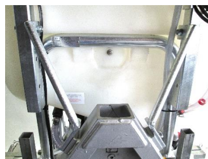
Sonderanbau: Streben für Geräterdreieck