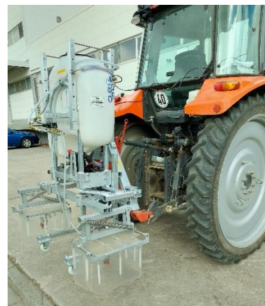
Aufbau auf ein Sondergestänge für Parzellentrennung im Versuchswesen