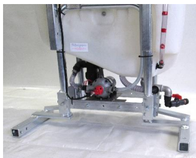
Sonderanbau: Konsolen für Geräterdreieck