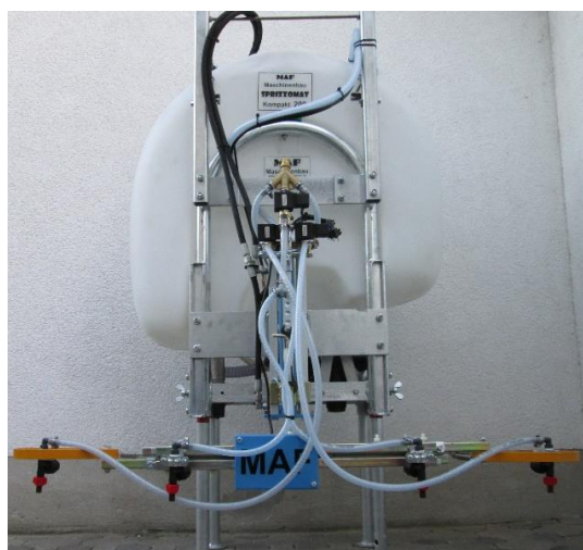
Ausstattung mit Bandspritzgestänge MAF uni 1 EDSm und hydraulischer Höhenverstellung und Ganzflächenabspritzung