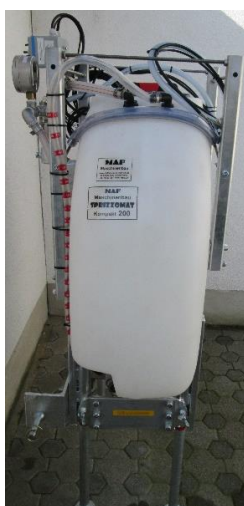
Ansicht von rechts